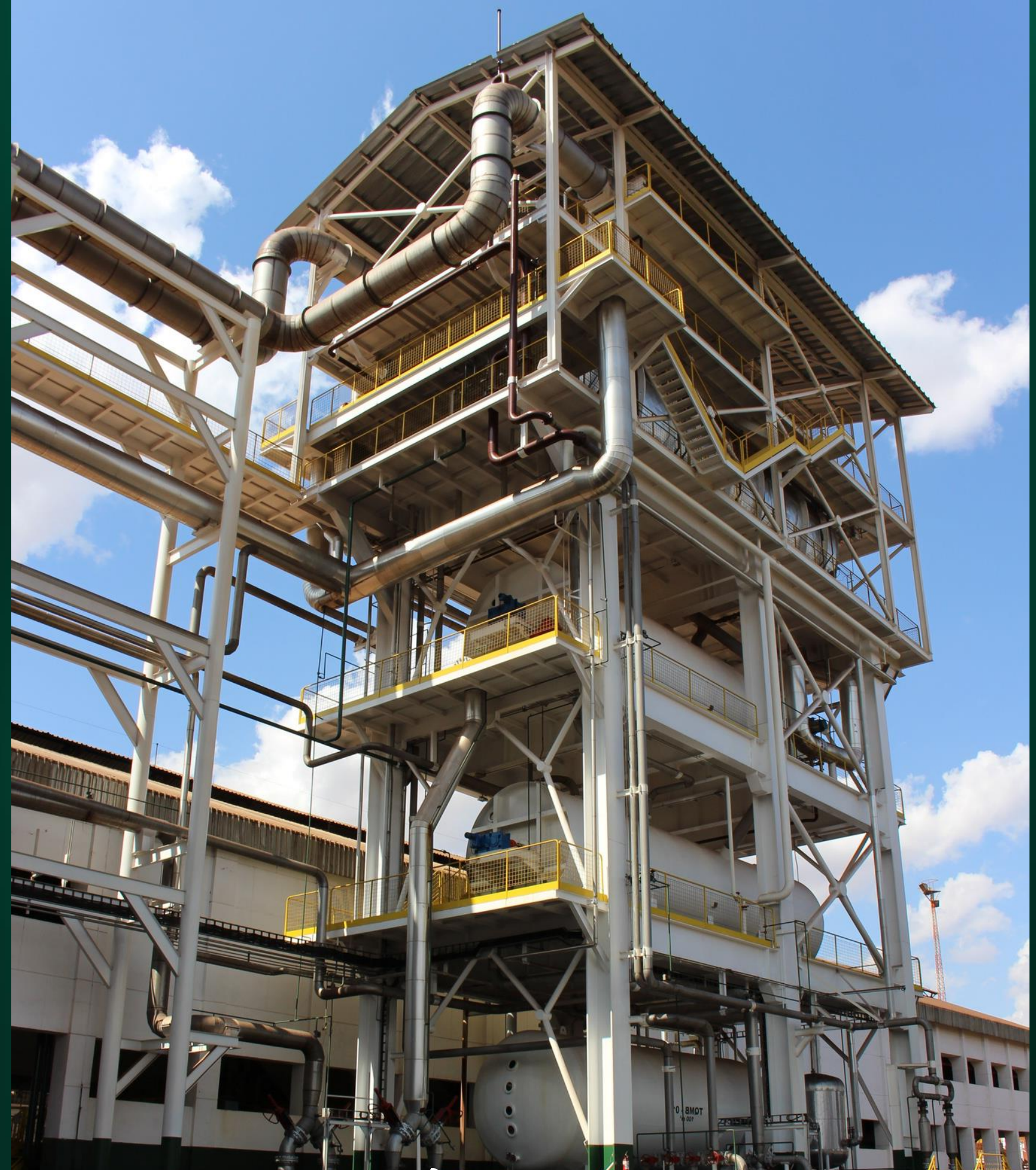
SISTEMA DE COZIMENTO CONTÍNUO | PEDRA AGROINDUSTRIAL