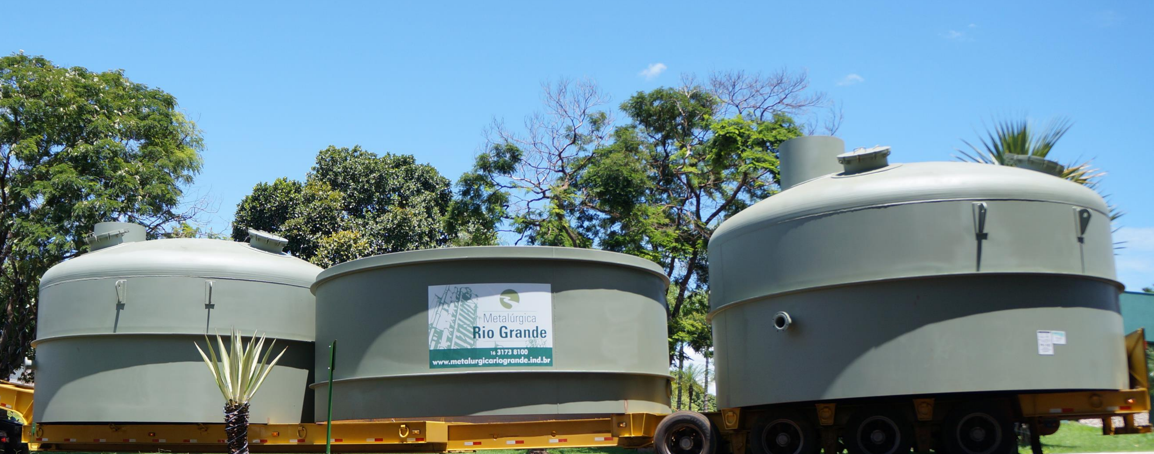
COZEDOR BATELADA 850 HL | IACO AGRÍCOLA